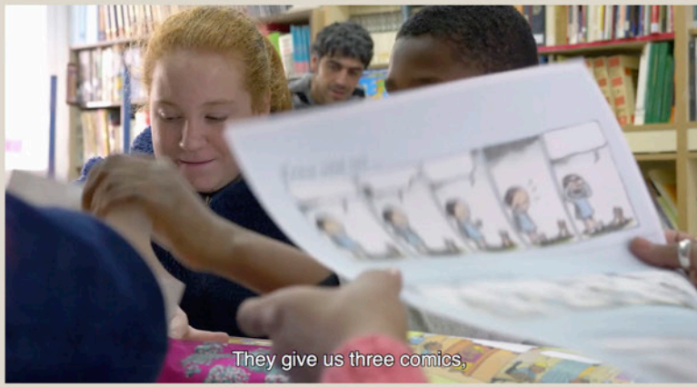
They give us three comics,