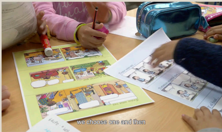
we choose one and then