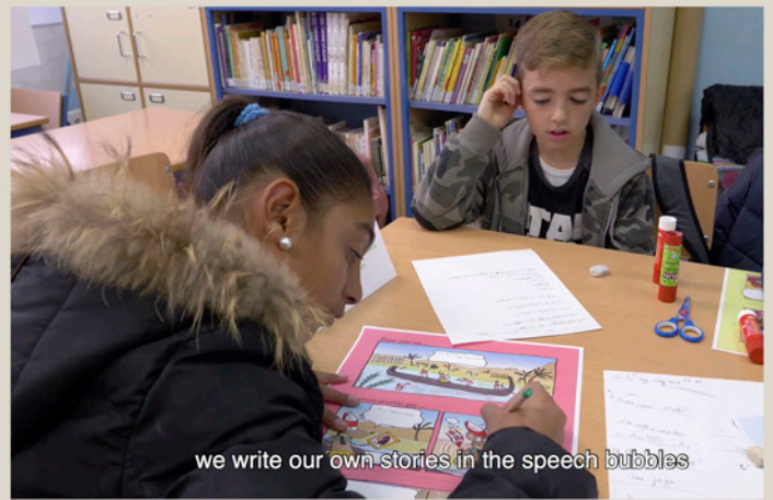
we write our own stories in the speech bubbles