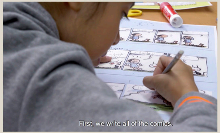
First, we write all of the comics.